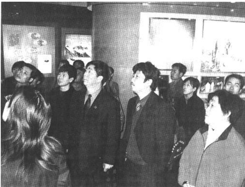
图为本报干部职工在参观学习。

等方面存在的问题，并自觉纠正；切实加强学习，不断提高政治素质和业务水平；围绕提高报社管理水平、办报质量等问题，积极建言献策，进一步激发内部活力，开创各项事业发展新局面。（本报记者）