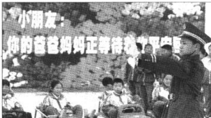
3月31日,一名少年在中国儿童青少年安全教育基地模拟十字路口指挥交通。据介绍,这是中国第一个儿童青少年安全教育基地。

据新华社福州3月31日电(李大伟 万初生)我国首例成人胰岛细胞移植治疗1型糖尿病在福州军区总医院获得成功。3月31日,接受手术的患者彻底摆脱了使用长达9年的胰岛素。